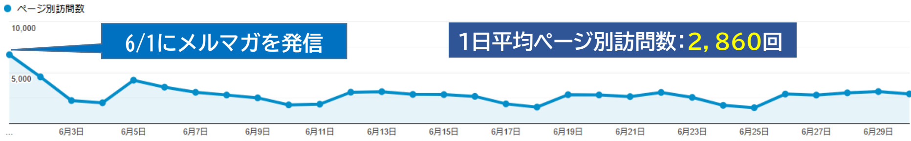
■本部HP 月別 ページ別 訪問数推移 (2022年4月~)