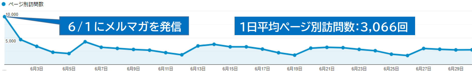
■本部HP 月別 ページ別 訪問数推移 (2021年4月~)