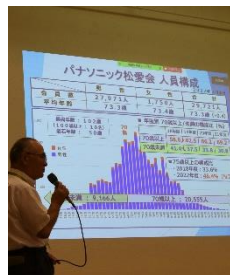
（山元福祉委員長 健康づくり活動推進について）