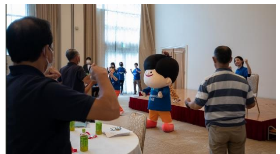
本日が『初お披露目』の Panasonic のお店 坊や ( ナショナル坊や では ありません )