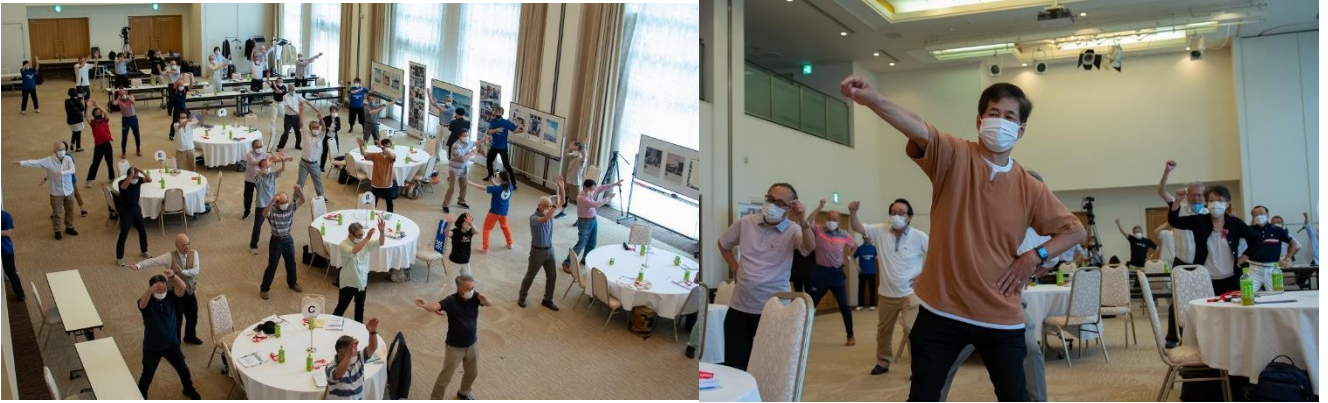
いつもより元気？に『元気ダンス』を踊るみなさん