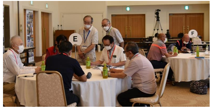
グループワーク：各支部の取り組み事例紹介 熱心に 情報交換・意見交換