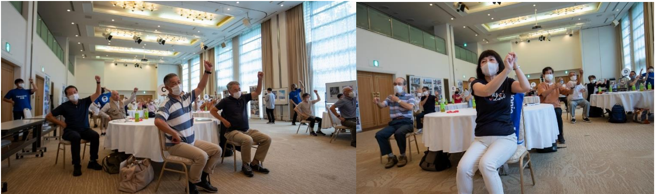
座った状態でも『元気ダンス』踊れます!!