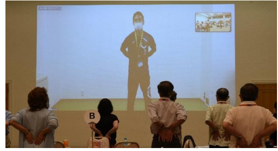
腰痛解消 ストレッチ