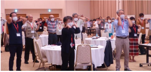
肩こり解消 ストレッチ