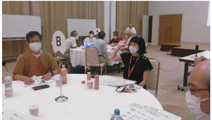
みんなで健康クイズをロールプレイング