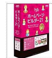
ホームページ・ビルダー21 スタンダード 通常版 2016 ジャストシステム